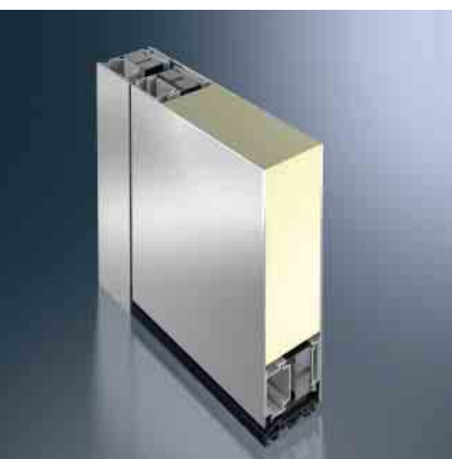
Schüco Türsystem ADS 75.SI Schüco door system ADS 75.SI